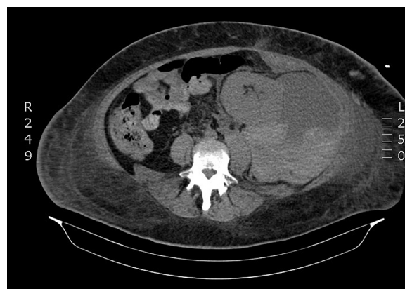
Figura 1 Hematoma periinjerto renal gigante.