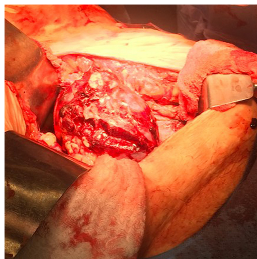
Figura 2 Rotura del injerto renal espontánea.